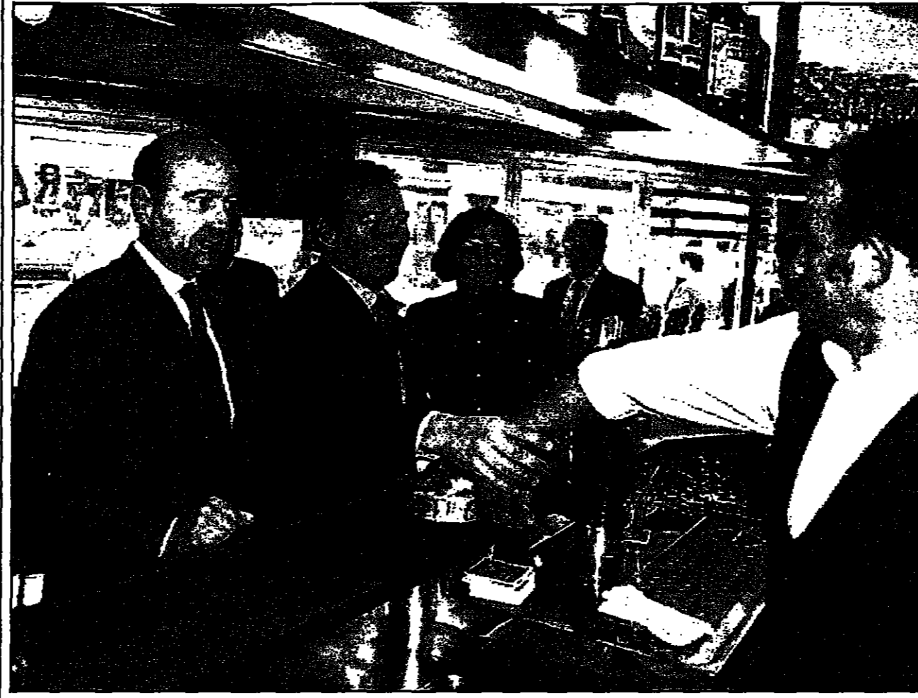
رئيس الوزراء آن جوبيه أثناء جولة انتخابية (ديتار)

شيراك قد يضطر لتكليف خصمه جوسبان رئاسة الوزراء